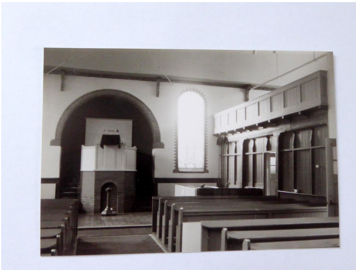
Centraal met preekstoel, rechtsboven de galerij

De kerkenraad kwamen uit de deur rechts en namen plaats in de banken voorin. De dominee liep gelijk door naar de preekstoel en had vanaf dat moment de leiding. Als ik mij goed herinner zaten de ouderlingen links (zie de foto van de zijbeuk).