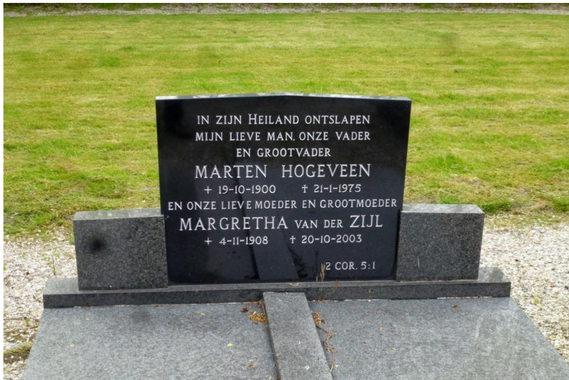
Bakker Hoogeveen en zijn vrouw

Als je als oud-Houwerzielster heimwee hebt naar het verleden, dan moet je ook eens gaan kijken op het kerkhof aan de Zwarteweg, want daar ligt het verleden broederlijk bijeen. De bekenden zijn dus nog steeds aanwezig, maar niet meer in levende lijve.