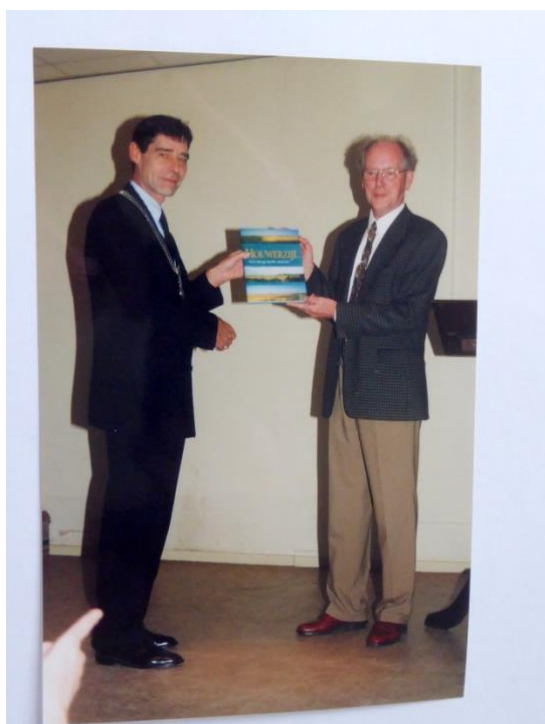
Het 1e boek