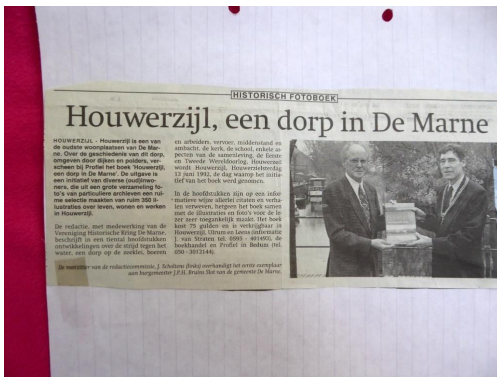
Verslag in de Groninger courant